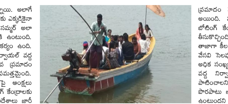
తెలిసింది. ఈ ప్రమాదంలో 13 మంది మృతి చెందారు. ప్రమాద సమయంలో పడవలో 35 నుంచి 40 మంది పర్యటకులు ఉన్నట్లు సమాచారం. ఈ ఘటన దేశవ్యాప్తంగా విషాదాన్ని మిగిల్పింది. ప్రమాదానికి సంబంధించిన దృశ్యాలు చూడాలన్నా కలచివేస్తున్నాయి. అయితే మధ్యప్రదేశ్ బోటు

హైదరాబాద్ : ప్రస్తుతం ఎండలు మండిపోతున్నాయి. అలాగే పిల్లలకు వేసవి సెలవులు ఇచ్చేశారు. విహారయాత్రకు ఎక్కడికైనా వెళ్లాలని చాలామంది షాన్ వేస్తుంటారు. ఇక సమ్మర్ అలా పోయినా బోట్ షికారు చేయాలని చాలామందికి ఉంటుంది. తెలంగాణలోనూ చాలా ప్రాంతాల్లో బోటింగ్ సౌకర్యం ఉంది. అయితే తాజాగా మధ్య ప్రదేశ్ లోని బార్సెలెనా రిజర్వాయర్ వద్ద నర్మదా నదిలో ఇటీవల జరిగిన ఘోర పడవ ప్రమాదం కారణంగా తెలంగాణ ప్రభుత్వం అప్రమత్తమైంది. తెలంగాణలోని బోటింగ్ ప్రాంతాల్లో భద్రతపై ఆంక్షలు విధించింది. ఈ మేరకు రాష్ట్రంలోని అన్ని బోటింగ్ కేంద్రాలకు తెలంగాణ వర్కబుక్ అభివృద్ధి సంస్థ నూతన ఆదేశాలు జారీ చేసింది. ప్రతికూల వాతావరణంలో బోటింగ్ ను నిలిపివేయాలని ఆదేశాలు ఇచ్చింది. రూల్స్ ను పాటించకపోతే కఠిన చర్యలు తప్పవని హెచ్చరికలు జారీ చేసింది. ఇటీవల మధ్యప్రదేశ్ జబల్ పూర్ జిల్లాలోని నర్మదా నదిపై ఉన్న బార్సెలెనా రిజర్వాయర్ వద్ద ఘోర పడవ ప్రమాదం జరిగిన విషయం