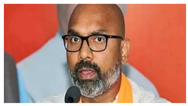
నిజామాబాద్, మే 03 : నిజామాబాద్ లో ఎంపీ ధర్మపురి అల్పింద్ మీడియా సమావేశంలో మాట్లాడుతూ.. రాష్ట్ర ప్రభుత్వం, ప్రతిపక్ష నేత కేసీఆర్ పై తీవ్రస్థాయిలో విమర్శలు చేస్తున్నామన్నారు. ఈ నెల 10న ప్రధాని నరేంద్ర మోడీ రాష్ట్రంలో రూ.8 వేల కోట్ల అభివృద్ధి పనులకు శంకుస్థాపన చేయనున్నారని ఆయన ప్రకటించారు. పనులు రైతులకు మంచి మద్దతు ధర

లభిస్తోందంటే దానికి కారణం ప్రధాని మోడీ మాత్రమేనని స్పష్టం చేశారు. కేసీఆర్ కు మతిభ్రమించింది. సమీప నాయకులను మోసం చేయడం ఆయనకు అలవాట. బీఆర్ఎస్ లో చేరిన జీవన్ రెడ్డిని కూడా కేసీఆర్ మోసం చేస్తారు, కేసీఆర్ శకం ముగిసి పోయింది. గత ప్రభుత్వ హయాంలో గ్రామీణ స్థాయిలో మత్తు పదార్థాలను సరఫరా చేశారు. రాష్ట్రంలో కాంగ్రెస్ ప్రభుత్వానికి పరిపాలనపై పట్టు లేదు. రేవంత్ రెడ్డి ప్రజలకు ఇచ్చిన హామీలను కూడా మరచిపోయారు. ధాన్యం కొనుగ్గలో తీవ్రస్థాయిలో జాప్యం జరుగుతోంది. రైతు పండించిన ప్రతి ధాన్యం గింజను వారం రోజుల్లోగా కొనుగోలు చేయాలని బీజేపీ అభిమేలుం జారీ చేసింది. నరైన్ పన్నుంది అని అన్నారు.