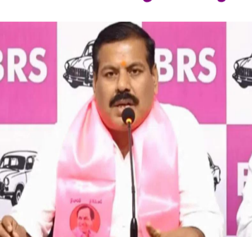
చెప్పి ఎలా కొట్టారు? ఎవరు చేస్తున్నారు? ఎవరి అండ చూసుకుని ఇలా చేస్తున్నారు?

తీసుకెళ్లి ఆ భూమిని కాపాడింది అప్పుడున్న మా బీఆర్ఎస్ ప్రభుత్వం అని గుర్తు చేశారు. ఇకనైనా మంత్రి చూపల్లి మామై తప్పుడు ప్రచారాలు మానుకోవాలని హితవు పలికారు. జూపల్లికి వయసు పెరిగినా.. బుద్ధి పెరగలేదని నష్టం దావా వేసి కోర్టుకు ఈడుస్తామని హెచ్చరించారు. బైగర్ రిజర్వ్ ఫారెస్ట్ లో ఉన్న 44 ఎకరాల సీలింగ్ భూముల్ని అమ్మారని ఆరోపణలు వచ్చాయి. దీనిపై మి మిత్రవర్గం సీపీఎం దృష్టికి తెచ్చినా స్పందించలేదు ఎందుకని అని ప్రశ్నించారు. బైగర్ రిజర్వ్ ఫారెస్ట్ లో