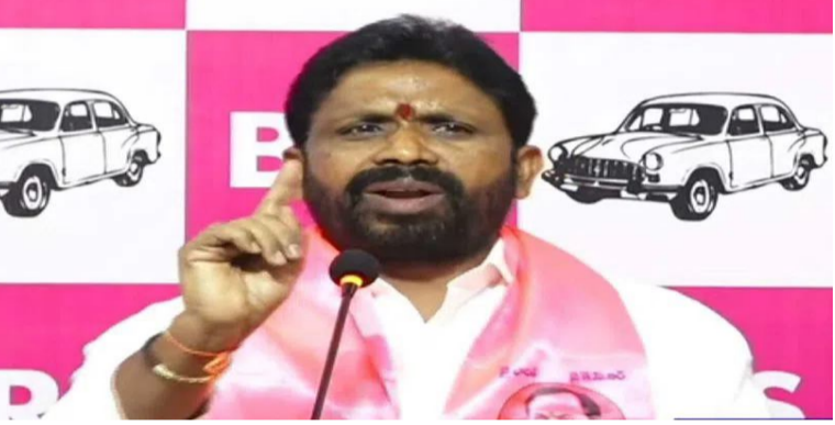
కాంగ్రెస్ నేతలు అబద్ధాలతో కాలం వెళ్లడంపై విమర్శించారు. అక్రమ మైనింగ్పై ప్రభుత్వం ఎందుకు చర్యలు తీసుకోవడం లేదని ప్రశ్నించారు. కమీషన్లు, కాంట్రాక్టులు

శ్రీనివాస్ డిమాండ్ చేశారు. అక్రమ మైనింగ్పై కాంగ్రెస్ నేతలు ఎందుకు మాట్లాడటం లేదని ప్రశ్నించారు. మైనింగ్పై మేం ఆధారాలతో సహా బయటపెట్టామని తెలిపారు. ప్రభుత్వ ఖజానాకు గండి కొడుతున్నారని పేర్కొన్నారు. కాంగ్రెస్ నేతలు అవినీతి చేసుకుంటూ మామై నిందలా అని మండిపడ్డారు. రాష్ట్రంలోని అన్ని శాఖల్లో అవినీతి జరుగుతోందని తెలిపారు. కాంగ్రెస్ నేతలు బాతులు తప్ప ప్రజలకు చేసినదేమీ లేదని ఎర్రోళ్ల శ్రీనివాస్ విమర్శించారు. బీజేపీ అవినీతిపై రాహుల్ గాంధీ రోజూ విమర్శలు చేస్తున్నారు.. మోడీ, అదానీ దగ్గర రాహుల్ ఎంత కమీషన్ తీసుకుంటున్నారో చెబితారా అని ప్రశ్నించారు. కమీషన్ తీసుకునే సీపీ మైన్ సంస్థలికాంగ్రెస్ అని విమర్శించారు.