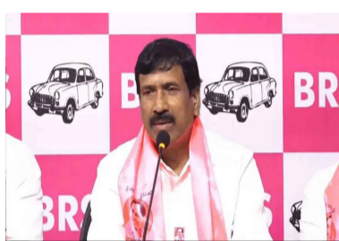
నరేందర్ రెడ్డి పాల్గొన్నారు. 20 రోజులుగా కల్లాలనే పద్దు ఉన్నాయని.. వెంటనే పద్దు కొనాలని డిమాండ్ చేశారు. బీఆర్ఎస్ ఆందోళనలతో రైతుబంధు తెలిపారు.

హైదరాబాద్ : ముఖ్యమంత్రికి రియల్ ఎస్టేట్ మీద ఉన్న ధాన్య రైతులపై లేదని మాజీ ఎమ్మెల్యే పట్నం నరేందర్ రెడ్డి విమర్శించారు. ఎందుకు వారో త్న వాలు నిర్వహిస్తున్నారో వాళ్లకే తెలియదని అన్నారు. కొడంగల్లో ఎంతమందికి రుణ మాఫీ అయ్యిందో చర్చకు సిద్ధమా అని సవాలు విోరారు. పంద శాతం రుణమాఫీ చేస్తే మళ్లీ నేను ఎమ్మెల్యేగా పోటీ చేయనని స్పష్టం చేశాడు. వికారాబాద్ జిల్లా బొంబాయిపేట మండలం మెట్టకుంటలో పద్ద కల్లాల దగ్గర బీఆర్ఎస్ నాయకులు ధర్మా చేపట్టారు. ఈ ధర్మాలో మాజీ ఎమ్మెల్యే పట్నం