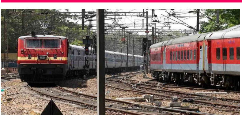
అమరావతి : ఎక్స్ ప్రెస్ రైలులో చోరీకి పాల్పడ్డ దొంగలపై పోలీసులు కాల్పులు జరిపిన

ఘటన ఆంధ్రప్రదేశ్ లో చోటు చేసుకుంది. చెంగల్పట్టు నుంచి కాకినాడకు వెళ్తున్న సర్కార్ ఎక్స్ ప్రెస్ రైలులో మంగళవారం తెల్లవారజామున దొంగలు చోరీకి పాల్పడ్డారు. ప్రయాణికుల నుంచి 5 తులాల బంగారు ఆభరణాలు అపహరించారు. గమనించిన ప్రయాణికులు చైన్ లాగి కేకలు వేయడంతో దొంగలు పారిపోయారు. స్పందించిన రైల్వే పోలీసులు దోపిడీ దొంగలపై కాల్పులు జరిపడంతో తప్పించు కుని పారిపోయారు. అయితే అనుమాని తుడిచి పోలీసులు అదుపులోకి తీసుకొని విచారిస్తున్నారు.