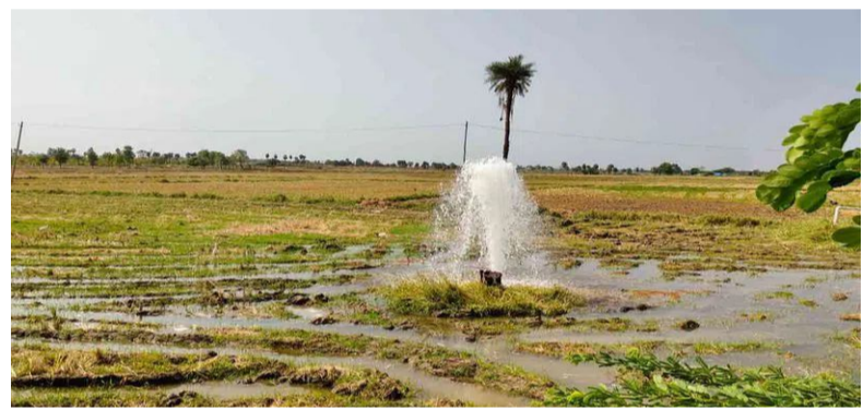
మాగసూరు జూన్ 15 : నారాయణపేట జిల్లా మాగసూరు మండల కేంద్రంలోని వ్యవసాయ పొలాల మధ్య నుంచి వెళ్తున్న మిషన్ భగీరథ

పైప్ లైన్ లో లీకేజీ కారణంగా వేలాది లీటర్ల తాగునీరు వృధాగా పోతుంది. పైప్ లైన్ లో పగులు ఏర్పడటంతో పంటలలో నీరు భారీగా ఎగసిపడు తో ది.కొం తకాలంగా పైప్ లైన్ లో లీకేజీ కానసాగు తున్న పుట్టికీ సంబంధిత అధికారులు పట్టించుకోవడం లేదని స్థానిక రైతులు ఆరోపిస్తున్నారు. కోట్ల రూపాయలతో నిర్మించిన మిషన్ భగీరథ పథకంలో ఇలాంటి లీకేజీల వల్ల ప్రభుత్వానికి ఆర్థిక నష్టం జంగడమే కాకుండా నీరు వృధా అవుతుందని ఆవేదన వ్యక్తం చేశారు. ఇప్పటికైనా అధికారులు స్పందించి వెంటనే మరమ్మతులు చేసి, నీటి వృధాను అరికట్టాలని కోరుతున్నారు. భవిష్యత్తులో ఇలాంటి ఘటనలు పునరావృతం కాకుండా మిషన్ భగీరథ పైప్ లైన్ లను క్రమం తప్పకుండా తనిఖీ చేయాలని డిమాండ్ చేస్తున్నారు.