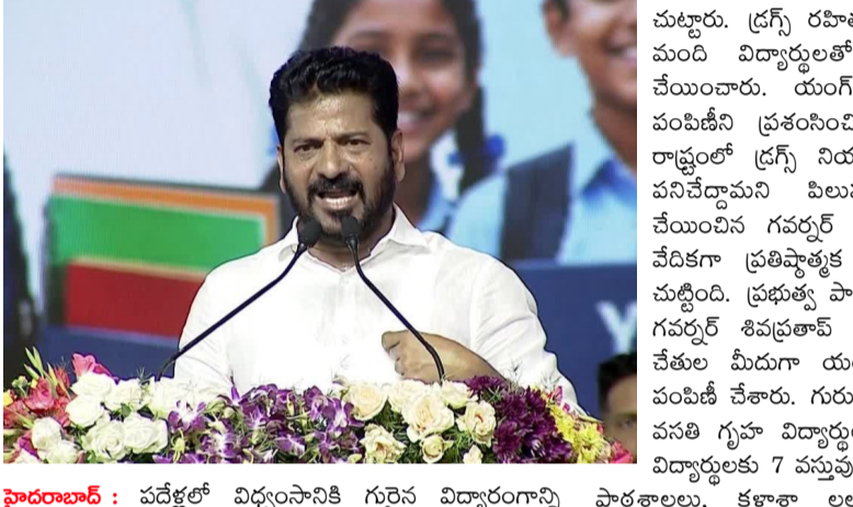
హైదరాబాద్ : పదేళ్లలో విధ్వంసానికి గురైన విద్యారంగాన్ని పాఠశాలలు, కళాశాలలను మార్కెట్ ప్రవేశంగా

సమూల ప్రక్షాళన చేస్తున్నట్లు ముఖ్యమంత్రి రేవంత్ రెడ్డి తెలిపారు. హైదరాబాద్ ఎన్టీ రోడ్డు స్టేడియం వేదికగా గవర్నర్ శివప్రతాప్ శుక్లాతో కలిసి ప్రభుత్వ గురుకుల విద్యార్థులకు యంగ్ ఇండియా ఎడ్యుకేషన్ కిట్ల పంపిణీకి శ్రీకారం చుట్టారు. డ్రగ్స్ రహిత తెలంగాణ లక్ష్యంగా 15 వేల మంది విద్యార్థులతో కలిసి సామాజిక ప్రతిజ్ఞ చేయించారు. యంగ్ ఇండియా ఎడ్యుకేషన్? కిట్ల పంపిణీని ప్రశంసించిన గవర్నర్ శివప్రతాప్ శుక్లా రాష్ట్రంలో డ్రగ్స్ నియంత్రణ కోసం అందరూ కలిసి పనిచేద్దామని పిలుపునిచ్చారు. సామాజిక ప్రతిజ్ఞ చేయించిన గవర్నర్ : హైదరాబాద్ ఎన్టీ రోడ్డు స్టేడియం వేదికగా ప్రతిష్ఠాత్మక పథకానికి ప్రభుత్వం శ్రీకారం చుట్టింది. ప్రభుత్వ పాఠశాలలు, గురుకుల విద్యార్థులకు గవర్నర్ శివప్రతాప్ శుక్లా, ముఖ్యమంత్రి రేవంత్ రెడ్డి చేతుల మీదుగా యంగ్ ఇండియా ఎడ్యుకేషన్ కిట్ల పంపిణీ చేశారు. గురుకుల విద్యార్థులకు 22 వస్తువులు, వసతి గృహ విద్యార్థులకు 10 వస్తువులు, పాఠశాల విద్యార్థులకు 7 వస్తువులతో కూడిన కిట్లు అందించారు. మార్కెట్ ప్రవేశంగా