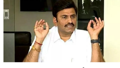
ప్రజా సమస్యలను పరిష్కరించేందుకు పల్లె శ్రీనివాసరావు, విష్ణుకుమార్ రాజు లాగా ఎమ్మెల్యేలు మరింత చొరవ చూచి సమస్యలను కమిటీ దృష్టికి తీసుకురావాలని రఘురామ కృష్ణరాజు కోరారు. భవిష్యత్తులో కూడా ఇలాంటి సమావేశాలను నిర్వహిస్తూ ప్రజలకు న్యాయం జరిగేలా చర్యలు తీసుకుంటామని చెప్పారు. ఈ సమావేశంలో చర్చించిన సమస్యలను పచ్చే రెండు నుంచి మూడు నెలల్లో పరిష్కరించేలా చర్యలు చేపడతామని రఘురామ స్పష్టం చేశారు.

విశాఖపట్నం: శాసనసభ పీఠిషన్స్ కమిటీ సమావేశంలో ప్రజా సమస్యల పరిష్కారంపై విస్తృతంగా చర్చించినట్లు కమిటీ చైర్మన్ రఘు రామకృష్ణరాజు తెలిపారు. గాజువాక ఎమ్మెల్యే పల్లె శ్రీనివాసరావు సమర్పించిన పీఠిషన్పై సుదీర్ఘంగా చర్చించామని చెప్పారు. ప్రతి సమస్య పరిష్కారానికి నిర్దిష్ట కాలపరిమితిని నిర్ణయించినట్లు ఆయన వెల్లడించారు. సమస్యలతో బాధపడుతున్న వ్యక్తులను నేరుగా సమావేశానికి తీసుకువచ్చి వారి అభిప్రాయాలను తెలుసుకున్నామని పేర్కొన్నారు. మానవతా దృక్పథంతో సమస్యలను పరిష్కరించేందుకు కమిటీ కృషి చేస్తోందన్నారు. విశాఖ ఎమ్మెల్యే విష్ణుకుమార్ రాజు కూడా పలు ప్రజా సమస్యలను కమిటీ దృష్టికి తీసుకువచ్చారని తెలిపారు. వివిధ అంశాలపై సమావేశం సమగ్రంగా చర్చించి, సంబంధిత అధికారులకు అవసరమైన సూచనలు చేసినట్లు చెప్పారు.