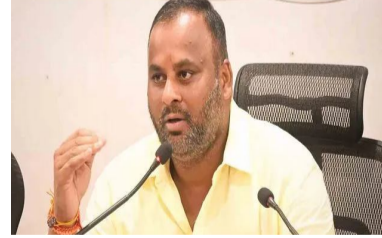
తగ్గిస్తున్నాం. రిజిస్ట్రేషన్ల సంఖ్య పెరగడం ద్వారా రాష్ట్ర ఖజానాకు ఆదాయం పెరగుతుంది. అలానే రవాణా శాఖకు వాహనాలపై మెరుగైన పర్యవేక్షణకు అవకాశం లభిస్తుంది. క్యాబినెట్ తీసుకున్న ఈ నిర్ణయం పట్ల రవాణా శాఖ మంత్రి మండిపల్లి రాంప్రసాద్ రెడ్డి హర్షం వ్యక్తం చేస్తూ.. ముఖ్యమంత్రి నారా చంద్రబాబు నాయుడుకు ప్రత్యేక కృతజ్ఞతలు తెలిపారు. రవాణా రంగ సంక్షేమానికి, ఆపరేటర్ల ప్రయోజనాలకు కూటమి ప్రభుత్వం కట్టుబడి ఉందనేందుకు ఈ నిర్ణయమే నిదర్శనమని ఆయన పేర్కొన్నారు. కేంద్రం పన్నుల తగ్గింపు మాత్రమే కాకుండా, బారిస్ట్ బస్సుల ఢిల్లీ, ఫిట్‌నెస్ పర్యవేక్షణను మరింత కఠినతరం చేస్తూ రాష్ట్ర ప్రయోజనాలను కాపాడతామని మంత్రి రాంప్రసాద్ స్పష్టం చేశారు.

అమరావతి, జూన్ 23: రాష్ట్రంలో పర్యాటక, రవాణా రంగాల అభివృద్ధికి కూటమి ప్రభుత్వం అత్యంత కీలకమైన నిర్ణయం తీసుకుంది. రాష్ట్రంలో టూలిస్ట్ బస్సుల నిర్వహణ భారాన్ని తగ్గించేలా.. పన్నుల తగ్గింపును రాష్ట్ర క్యాబినెట్ గ్రీన్ సిగ్నల్ ఇచ్చింది. రవాణా శాఖ మంత్రి మండిపల్లి రాంప్రసాద్ రెడ్డి ప్రత్యేక చొరవ, వాహన యజమానుల సుదీర్ఘ విజ్ఞప్తుల నేపథ్యంలో ప్రభుత్వం ఈ నిర్ణయాన్ని ప్రకటించింది. దీని ప్రకారం.. 'అఖిల భారత పర్యాటక పవీల్' కలిగిన బారిస్ట్ బస్సులకు ప్రతి సీటుపై విధించే ట్రిమాసిక్ పన్నును రికార్డు సామాన్ తగ్గించారు. ఇప్పటివరకు ఉన్న రూ. 4,000 పన్నును రూ. 2,500కు తగ్గిస్తూ మంత్రి మండిపల్లి ఆమోదం తెలిపింది. గతంలో భారీగా ఉన్న పన్నుల భారం కారణంగా ఏపీకి చెందిన వలువురు బస్సు ఆపరేటర్లు తమ వాహనాలను పొరుగు రాష్ట్రాల్లో రిజిస్ట్రేషన్ చేయించుకున్నారు. తాజా పన్ను తగ్గింపుతో ఆయా రాష్ట్రాలకు వెళ్లిన బస్సుల రిజిస్ట్రేషన్లు తిరిగి ఏపీకి వచ్చేందుకు మార్గం సుగమమైంది. తద్వారా రాష్ట్ర రవాణా రంగానికి కొత్త ఊపు రావడమే కాకుండా, పర్యాటక రంగానికి మరింత ప్రోత్సాహం లభించనుంది. వాహన యజమానులపై పన్ను భారం గణనీయంగా