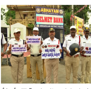
లేకుంటే రనోల్ అవుతారని వాహనదారులకు వివరిస్తున్నారు. ఇంత చెబుతున్నా హెల్మెట్ లేకుండా రోడ్డుపైకి నిర్లక్ష్యంగా వచ్చే బైకర్లలో మార్పు తెచ్చేలా నూతన ఒడవడికి శ్రీకారం చుట్టారు. తాత్కాలికంగా హెల్మెట్ అందించే ఉద్దేశంతో 'అభయం' పేరుతో హెల్మెట్ బ్యాంకులు ఏర్పాటు చేశారు. అభయం యాన్? రోడ్డు మీద శిరస్రాణం లేకుండా ఎవరైనా కనిపిస్తే వారికి బ్యాంక్ నుంచి తాత్కాలికంగా హెల్మెట్ అందజేస్తారు. లేదా ఏ కారణంతోనైనా

శ్రీకాకుళం జిల్లా: యాక్సిడెంట్ అంటే వాహనం రోడ్డుపై పడటం కాదు ఒక కుటుంబం మొత్తం రోడ్డుపై పడటం. ప్రమాదం ఎప్పుడు ఏ రూపంలో వస్తుందో ఎవరూ ఊహించలేరు. అందుకే ప్రతి ప్రయాణంలోనూ ద్విచక్రవాహనదారులు హెల్మెట్‌ను భాగం చేసుకోవాలని సికిల్‌లు పోలీసులు కోరుతున్నారు. సైల్ కోసం ప్రాణాలను పణంగా పెట్టుకుంటూ హెల్మెట్ల ధరించి సురక్షితంగా ఇల్లు చేరాలంటున్నారు. కేవలం నలభైలకే పరిమితం కాకుండా అభయం పేరుతో హెల్మెట్ బ్యాంకులకు రూపకల్పన చేశారు. ఇంతకంటే ఎండ్ అభయం ఈ ఆలోచన ఉద్దేశమే? అనే మరెన్ని వివరాల గురించి ఈ కథనంలో తెలుసుకుందాం. బైకర్లలో మార్పు: అమ్మ జన్మనిస్తే హెల్మెట్ పునర్జన్మ ఇస్తుంటున్నారని శ్రీకాకుళం జిల్లా పోలీసులు, హెల్మెట్ బైక్ సడీపీ వ్యక్తి మాత్రమే కాకుండా ఆయన కుటుంబానికి రక్షణ కల్పిస్తుందని అవగాహన కల్పిస్తున్నారు. హెల్మెట్ ఆఫ్ఫన్ కాదు, అవసరమని అది ధరిస్తే లైఫ్ నాట్ అని