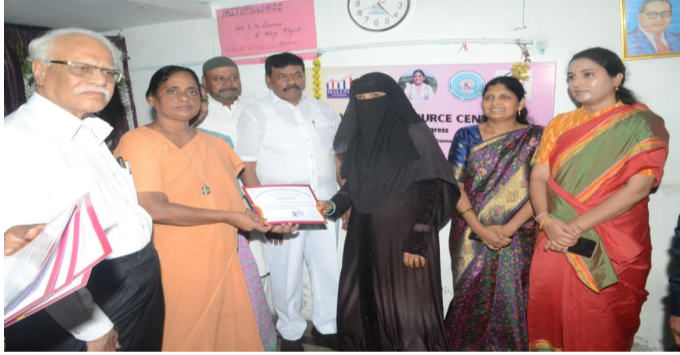
కూడా ఆర్థిక అవకాశాలు ఎంతగానో లభిస్తాయని కావున మహిళలు ఇటువంటి అవకాశాన్ని సద్వినియోగం చేసుకోవాలని సూచించారు శిక్షణ పూర్తి చేసుకున్న మహిళలకు ప్రభుత్వ