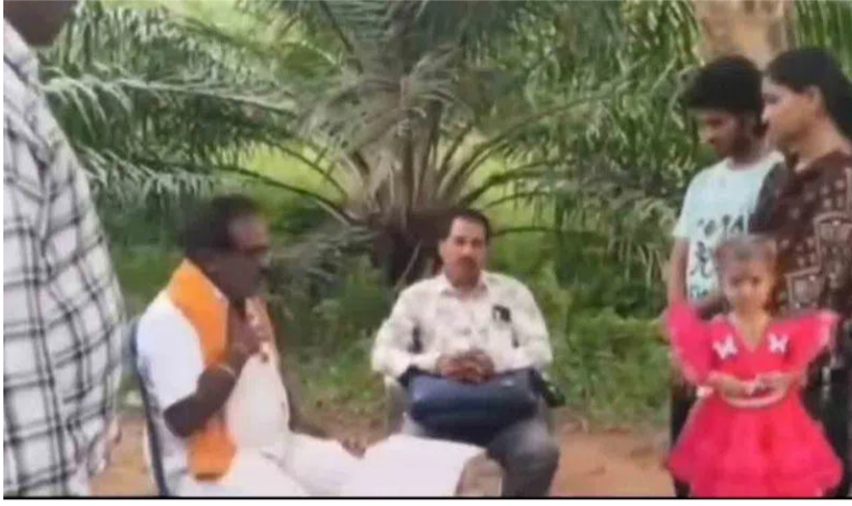
కు ఎలాంటి హాసీ జరుగలేదు. పాప ఎక్కడూ న్నా సురక్షితంగానే ఉంది. ఆమె పక్కా దొంగ కన్నదని కూడా నేను చెప్పగలను. నాకు ఆ శక్తి ఉంది. అమ్మాయి ఈ లొకేషన్లో ఉందంటూ నడరు జ్యోతిష్యుడు చెప్పడం అందరినీ విస్వయానికి గురిచేస్తోంది. దీనికి సంబంధించిన వీడియో ఇప్పుడు నెట్టింట్ వైరల్ అవుతోంది.