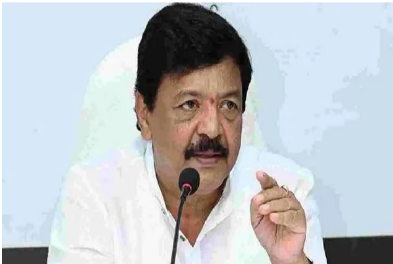
చిన్నట్లు మంత్రి తెలిపారు. యువతకు ప్రపంచ కట్టుబడి ఉండవచ్చు. రాష్ట్రంలో క్రియేటివ్ స్థాయి ఫిల్మ్ మేకింగ్ పై అవగాహన కల్పిస్తామని తెలిపారు. సినీ, మీడియా రంగాల్లో కొత్త ఉపాధి అవకాశాలు సృష్టించేందుకు ప్రభుత్వం

అమరావతి, జూన్ 25: నవ్యాంధ్రలో సరికొత్త 'క్రియేటివ్ ఎకానమీ విప్లవం'కు శ్రీకారం చుట్టినట్లు సినీమాలోగ్రఫీ శాఖ మంత్రి కందుల దుర్గేష్ వెల్లడించారు. ఈరోజు (గురువారం) రాష్ట్ర సచివాలయంలో మంత్రిని జాడెక్స్ ఇన్వేటివ్స్ ప్రైవేట్ లిమిటెడ్ ప్రతినిధులు కలిసి పలు అంశాలపై చర్చించారు. రాష్ట్రంలోని స్థానిక యువత ప్రతిభను ప్రోత్సాహించడంతో పాటు.. యువతకు ఆధునిక సినీ సాంకేతిక పరిజ్ఞానంపై శిక్షణ అందించేందుకు ప్రభుత్వం ప్రత్యేక కార్యచరణను రూపొందిస్తున్నట్లు మంత్రి తెలిపారు. జూలై నెలలో మోగా ఫిల్మ్ పర్మిషన్ నిర్వహించేందుకు సన్నాహాలు చేస్తున్నామని మంత్రి చెప్పారు. సినీ పరిశ్రమకు సంబంధించిన 24 క్రాఫ్ట్ పై ప్రత్యేక శిక్షణ కార్యక్రమాలు చేపట్టనున్నట్లు వెల్లడించారు. ఏవ ఆధారిత ఫిల్మ్ మేకింగ్ నైపుణ్యాలపై శిక్షణ ఇస్తున్నట్లు తెలిపారు. 24 క్రాఫ్ట్ శిక్షణకు సంబంధించి జాడెక్స్ సంస్థ రూపొందించిన యాక్షన్ ప్లాన్ పై సమావేశంలో సమగ్రంగా చర్చించారు.