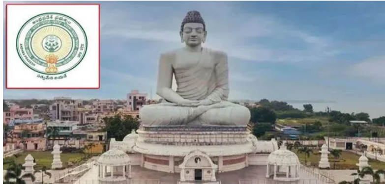
ట్రాన్స్ కు రెండేళ్ల డిఫెక్ట్ లయబిలిటీ పీరియడ్ ను నిర్దేశించింది. ఈ ప్రాజెక్టుకు సంబంధించి జూన్ 19న జరిగిన ఏపీసీ ఆర్డీపీ ఆధారిత సమావేశంలో తీర్మానం నెం.6699/2026 ఆమోదం పొందింది. అంతరం ప్రభుత్వం జీ.ఆర్.ఎం.777ను జారీ చేస్తూ అధికారిక ఉత్తర్వులు విడుదల చేసింది. పనులు అవారూ జారీ చేసేందుకు ఏపీసీఆర్ డీపీ

అమరావతి, జూన్ 25: ఏపీ రాజధాని అమరావతి అభివృద్ధి మరో కీలక అడుగు పడింది. ఉండవల్లి బోన్-11 పరిధిలో ట్రాన్స్ మౌలిక సదుపాయాల అభివృద్ధి పనులకు రాష్ట్ర ప్రభుత్వం ఆమోదం తెలిపింది. మొత్తం రూ.426.46 కోట్ల వ్యయంతో భారీ మౌలిక సదుపాయాల పనులను చేపట్టనుంది. ఈ ప్రాజెక్టుకింద రోడ్లు, డ్రైన్లు, సరఫరా, సెవరేజీ పనులకు ప్రభుత్వం గ్రీన్ సిగ్నల్ ఇచ్చింది. విద్యుత్ సరఫరా, ఐసీటీ యూటిలిటీ డక్లు, రియాజ్ వాటర్ లైన్ నిర్మాణానికి ప్రభుత్వం ఆమోదం తెలిపింది. ఎన్టీపీ ఏర్పాటు, అవసరమైతే షాంట్ల పనులు కూడా ఈ ప్రాజెక్టులో భాగంగా అమలు చేయనున్నారు. అమరావతి ల్యాండ్ హులింగ్ లేఅవుట్ అభివృద్ధికి అవసరమైన ఈ పనులను ప్యాకేజీ-38 కింద చేపట్టనున్నారు. ఎం-1 బిల్డింగ్ ఎంపికైన ఎన్టీపీ లిమిటెడ్ కు పనులను కేటాయించేందుకు ప్రభుత్వం ఆమోదం తెలిపింది. అంచనా వ్యయం రూ.409.78 కోట్లూ ఉండగా, 4.07 శాతం అధిక బిడ్డుకు అనుమతి ఇచ్చింది. ఈ కాం