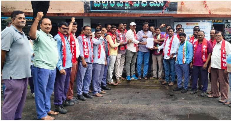
కొమరంభం ఆసిఫాబాద్ జిల్లా విశాలజ్యోతి: