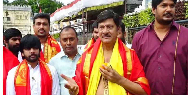
తలసీలాల నమర్చించు కున్నారు. భక్తులు సమర్పించుకున్న కాసుకల ద్వారా హుండీకి రూ. 4.39 కోట్లు ఆదాయం వచ్చిందన్నారు. 4.16 లక్షల లడ్డాలను విక్రయించామని, 1.93 లక్షల మంది భక్తులకు అన్నప్రసాదం అందించామని వెల్లడించారు.

తిరుమల : ప్రముఖ సినీ నటులు రాజేంద్ర ప్రసాద్ సాయికుమార్ గురువారం వీటి ప్రాంతం భవిష్యత్తును సమయంలో తిరుమల శ్రీవారిని దర్శించుకున్నారు. ఈ సందర్భంగా ప్రత్యేక పూజల అనంతరం మొక్కులు చెల్లించుకున్నారు. ఇద్దరికీ రంగనాథులకు మండపంలో అర్చకులు తీర్థ ప్రసాదాలు అందించి వేదాశ్రీ రచన అందజేశారు. వారు అలయం బయట అభిమానులతో ఫోటోలు దిగారు. శ్రీవారి హుండీకి రూ. 4.39 కోట్లు ఆదాయం తిరుమలలో భక్తుల రద్దీ కొనసాగుతుంది. బుధవారం వివిధ ప్రాంతాల నుంచి వచ్చిన భక్తులతో 27 కంపార్టుమెంట్లు నిండిపోయాయి. టోకెన్లు లేని భక్తులకు 10 గంటల్లో సర్దుదర్చనం అవుతుందని టీటీడీ అధికారులు వివరించారు. స్వామివారిని 78,067 మంది దర్శించుకోగా 31,158 మంది