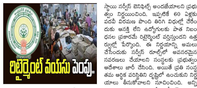
స్థాయి సర్వీస్ టెనిఫిట్స్ అందజేయాలని ప్రభుత్వం నిర్ణయించింది. ఇప్పటికే 60 ఏళ్లకు పదవీ విరమణ పొంది తిరిగి విధుల్లో చేరేందుకు ఆసక్తి లేని ఉద్యోగులకు పాత నిబంధనల ప్రకారం రిటైర్మెంట్ వర్షిఫికేషన్ ఉత్తర్వుల్లో పేర్కొంది. ఈ నిర్ణయాన్ని అమలు చేసేందుకు సర్వీస్ రూల్స్ లో అవసరమైన అడ్రెస్ లు జారీ చేసింది. అయితే ప్రతి సంవత్సరం అర్థిక పరిస్థితిని దృష్టిలో ఉంచుకుని నిర్ణయాలు తీసుకోవాలని సూచించింది. అన్ని శాఖలు తమ పరిధిలోని పీఎస్ యాలు, కార్పొరేషన్లు, సొసైటీలకు వెంటనే ఉత్తర్వులను పంపాలని రాష్ట్ర ప్రభుత్వం ఆదేశించింది.

అమరావతి, జూలై 2: పీఎస్ యాల, కార్పొరేషన్లు, సొసైటీల ఉద్యోగులకు సంబంధించిన పదవీ విరమణ వయసుపై ఏపీ ప్రభుత్వం కీలక నిర్ణయం తీసుకుంది. ప్రస్తుతం ఉన్న 60 ఏళ్ల పదవీ విరమణ వయసును 62 ఏళ్లకు పెంచుతూ ప్రభుత్వం జీవో జారీ చేసింది. గతంలో రాష్ట్ర మంత్రిమండలి ఆమోదించిన తీర్మానానికి అనుగుణంగా సర్కార్ ఉత్తర్వులు ఇచ్చింది. ప్రభుత్వ ఉత్తర్వుల ప్రకారం ఈ నిర్ణయం 2022 జనవరి 1 నుంచి రిట్రో స్పెక్టివ్ గా అమలు కానుంది. అలాగే, 60 ఏళ్ల వయసులో పదవీ విరమణ పొందిన అర్హులైన ఉద్యోగులను తిరిగి విధుల్లోకి తీసుకునే అవకాశం ఉంది. మళ్లీ జాబ్ లో చేరే వరకు ఉన్న గృహ వీరియర్లకు జీతం ఉండదని