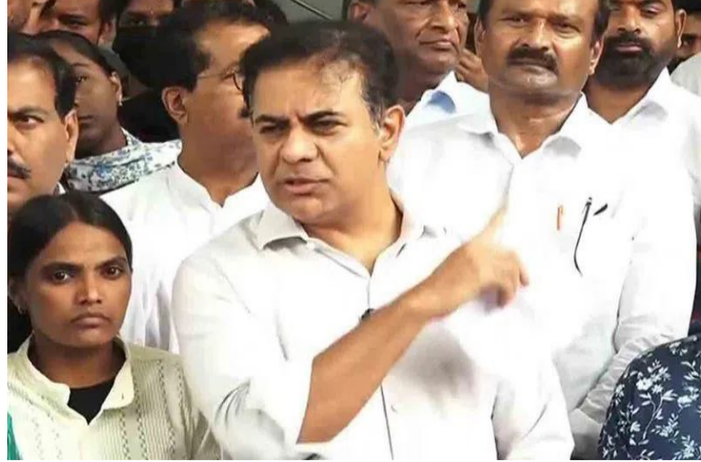
అనుముల బ్రదర్స్ సంపాదిస్తున్నారు. 56 వేలు పోలీసులు ఉద్యోగాలు వస్తాయని రేవంత్ రెడ్డి చెప్పారు. ఇప్పుడు 5 వేల ఉద్యోగాలే వస్తాయని అంటున్నారని మండి పడ్డారు. బీఆర్ఎస్ హయాంలో 95 శాతం స్థానిక యువతకి ఉద్యోగాలు వచ్చేలా చేశామన్నారు. చేతగాని అసమర్థ సర్కార్ పై పోరాడుతమని స్పష్టం చేశారు.

హైదరాబాద్: మంత్రి జూపల్లి కృష్ణారావుకు దమ్ముంటే గన్ పార్క్ వద్ద ఉండాలి అని బీఆర్ఎస్ వర్కింగ్ ప్రెసిడెంట్ కేటీఆర్ సవాలు విసిరారు. రాష్ట్రంలోని అప్పులపై చర్యలు తీసుకోవడానికి మంత్రి జూపల్లి తెలంగాణ భవన్ కు 11 గంటలకు వస్తానని ఎందుకు రాలేదని ప్రశ్నించారు. ఈ సందర్భంగా ఆయన తెలంగాణ భవన్ లో మీడియాతో మాట్లాడారు. బహిరంగ వేదికల్లో ప్రశ్నించే దమ్ము కాంగ్రెస్ పార్టీకి లేదన్నారు. చేతకాని వాళ్లు ఎందుకు సవాల్ చేయడమెందుకు తెలంగాణ భవన్ కు వస్తామని ఫోజు కొట్టి పారిపోవడం మొదలుపెట్టారు. చేతకాని వాళ్లు మాటలెక్కువ చెల్లని, నాణ్యత గీత లెక్కువ అని ఎద్దేవా చేశారు. నేను గన్ పార్క్ వస్తే చార్మినార్ రమ్మం తాగేమోనని ఎద్దేవా చేశారు. గత ప్రభుత్వంలో ఏం జరిగిందో ఇప్పుడు ఏం జరుగుతుందో చర్చించేందుకు మేము సిద్ధంగా ఉన్నామని పేర్కొన్నారు. దమ్ముంటే అనిబ్బి పెట్టి మాకు మాట్లాడేటైం ఇవ్వండి. కాంగ్రెస్ ప్రభుత్వ అవినీతిని నిరూపిస్తామన్నారు. ఆదానిని మించిపోయేలా